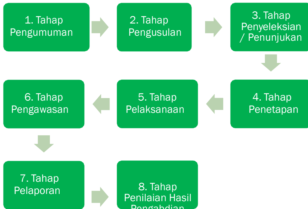
Diagram Alur Tahapan Pengelolaan Pengabdian

Secara umum, tahapan kegiatan pengabdian meliputi pengumuman penerimaan usulan, pengusulan, penyeleksian/penunjukan, penetapan penerimaan, pelaksanaan, pengawasan, pelaporan, dan penilaian keluaran. Jadwal semua tahapan kegiatan tersebut disampaikan oleh LPPM melalui laman website LPPM, poster, surat edaran dan/atau melalui media lain. Kewenangan setiap tahapan pengabdian berdasarkan kelompok kinerja pengabdian diatur sebagaimana di bawah ini: